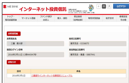
パソコン画面(イメージ)