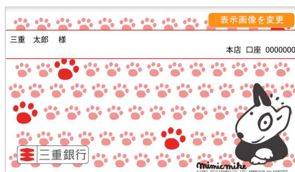
スマートフォン通帳表紙